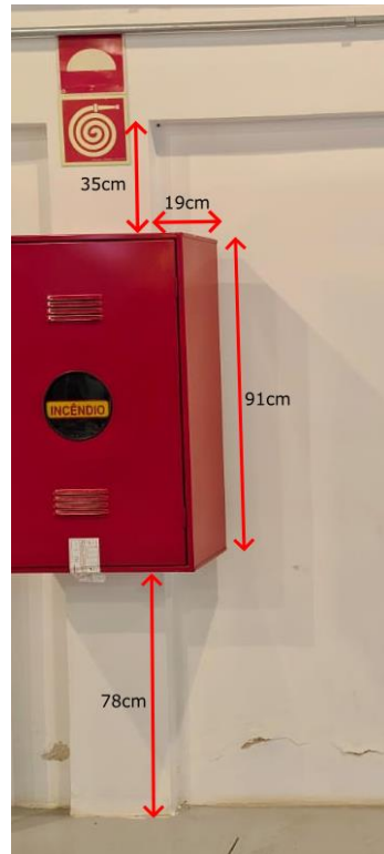
Detalhamento - Elementos fixos da Parede 3