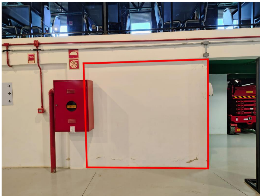
Parede 3 – Tema: Economia Solidária