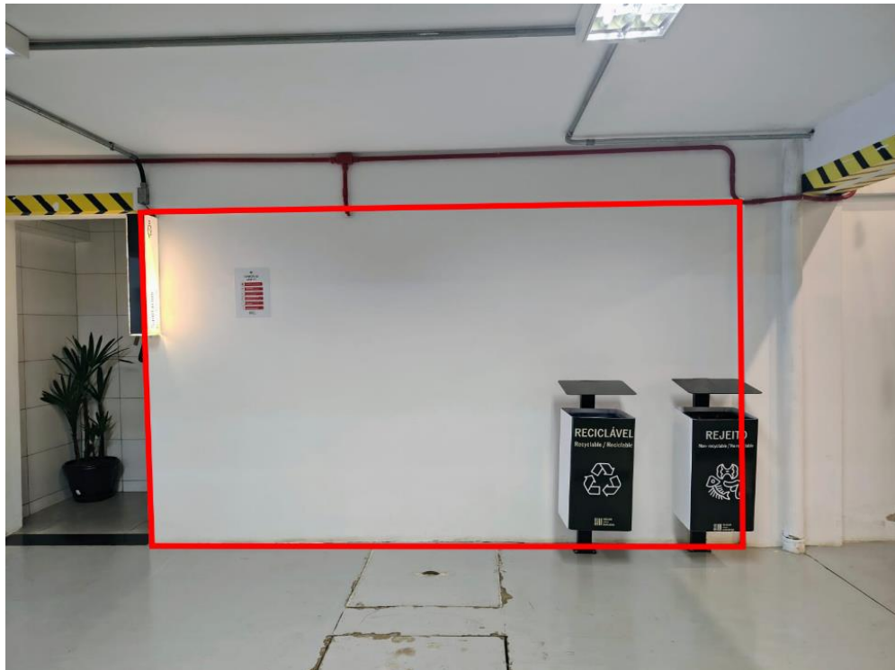
Parede 1 - Economia Circular